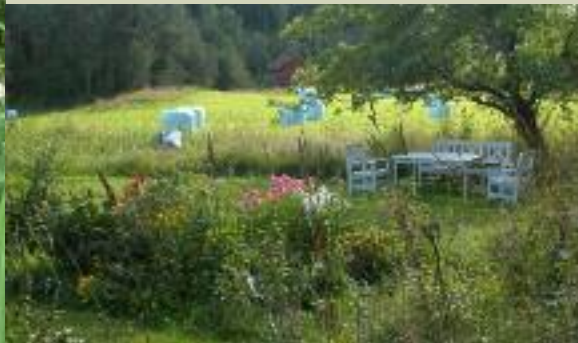
Ontspannen in landelijke tuin