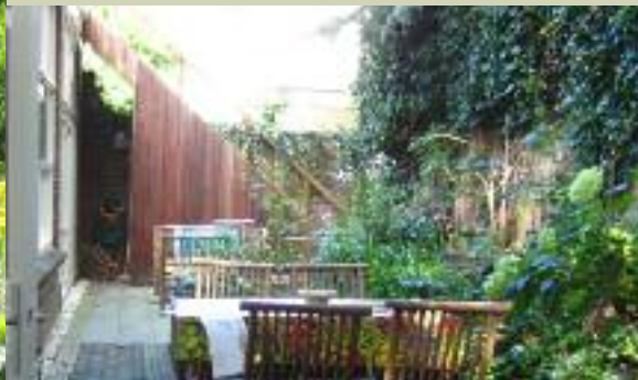
Buitenkamer in de stad