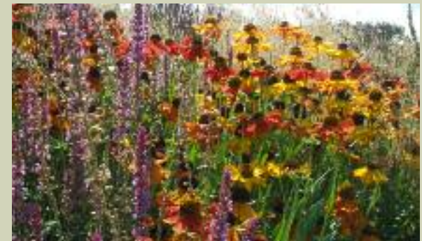
Nazomer bloei geeft wintersilhouetten