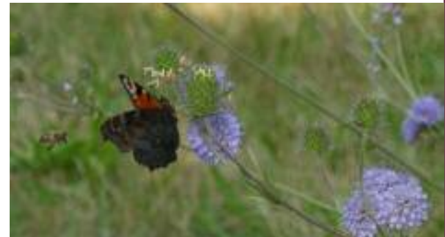
Nectar voor insecten