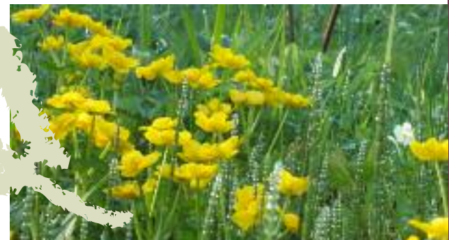
Water in je tuin