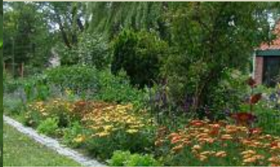
Vaste planten border in stadstuin